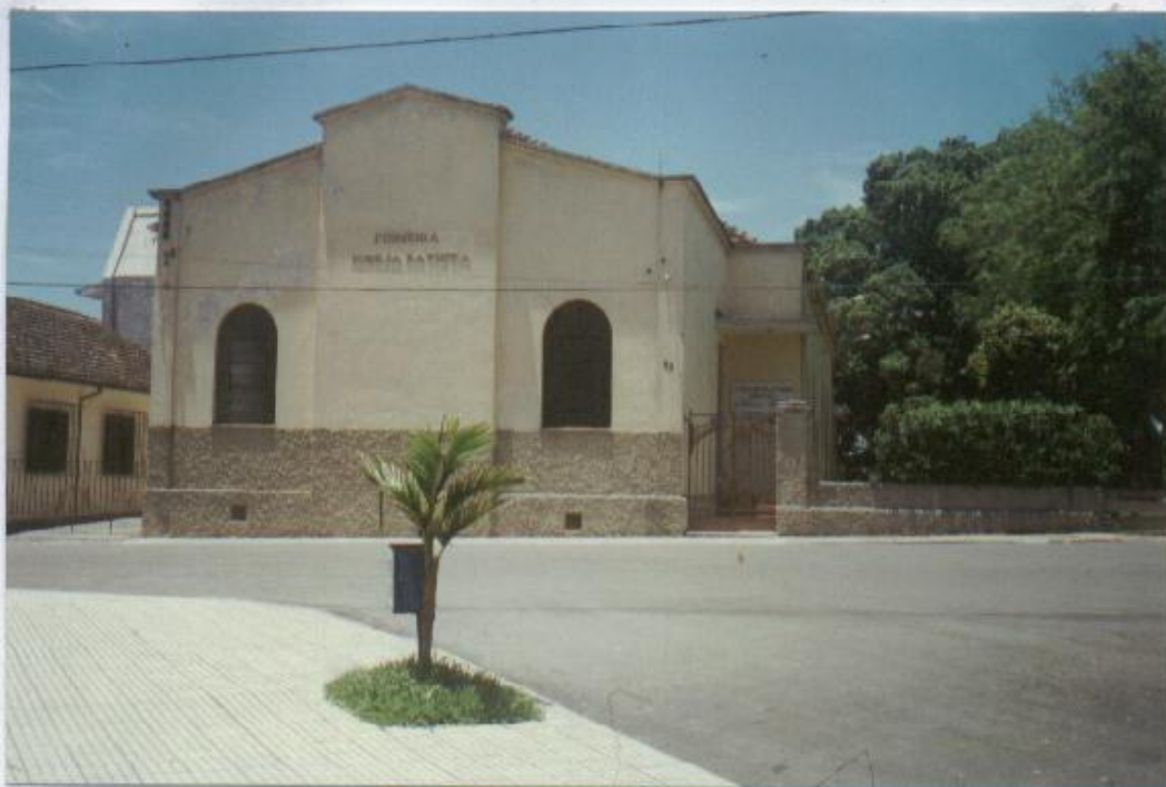
Vista da antiga residência da família de Hugo de Oliveira na rua José do Patrocínio nº92 em frente ao atual Colégio Estadual Manoel Ribes, prédio que após reformas, transformou-se na atual Primeira Igreja Batista.